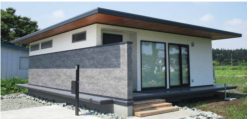
写真提供: 八戸住宅工房株式会社 W・E邸