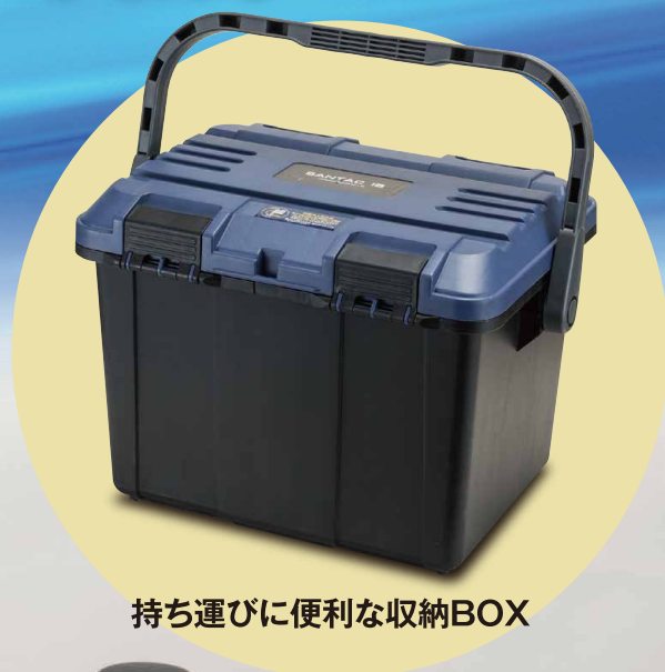
持ち運びに便利な収納BOX